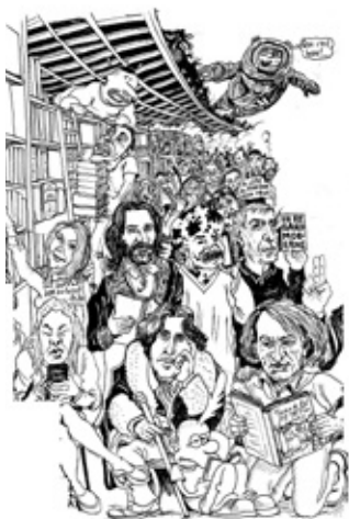
© Laurent Lolmède. Détail dessin en cours de réalisation.